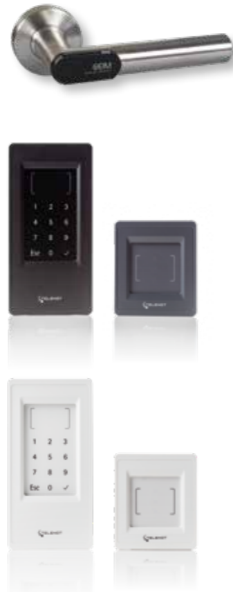
Moderne cryptlock-RFID-Zutrittskontrollleser aus dem Hause TELENOT sichern den Zugang.

Über das Schloss und den Leser wird in unscharfem Zustand der Anlage die Zutrittskontrolle geregelt. Die Mitarbeiter erhalten per Transponderchip oder Smartphone Zugang zum Gebäude. Geht ein Chip verloren, muss nicht das komplette Türschloss ausgetauscht werden, sondern der verloren gegangene Chip wird einfach gesperrt und der betroffene Mitarbeiter erhält einen neuen.