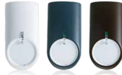
Bewegungsmelder überwachen die Räume und sichern das Objekt gegen Eindringlinge.

Zur VdS-gemäßen Absicherung von Lichtkuppeln oder Oberlichtern auf Durchstieg, dient der Bewegungsmelder histar (Vorhang-Charakteristik) mit entsprechendem Deckenmontagewinkel - nebst seiner eigentlichen Funktion als Bewegungsmelder. Dies stellt häufig die technisch einzige und wirtschaftlich sinnvollste Lösung dar.