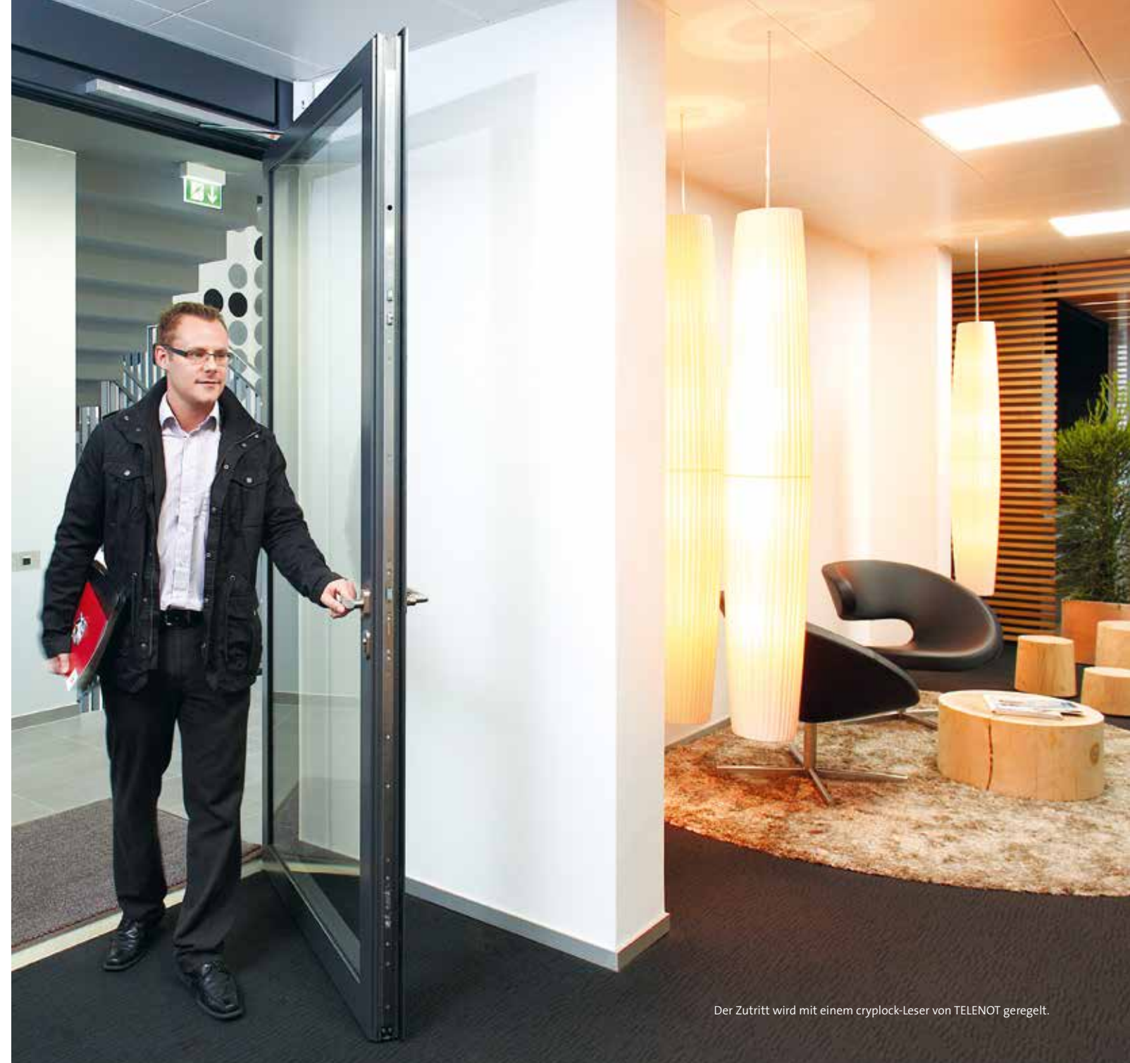
Der Zutritt wird mit einem cryplock-Leser von TELENOT geregelt.