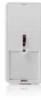
Bewegungsmelder histar 1000

Je nach Gebäudetyp gibt es weitere Möglichkeiten der Außenhautüberwachung. Zur VdS-gemäßen Absicherung von Lichtkuppeln oder Oberlichtern auf Durchstieg, dient der Bewegungsmelder histar (Vorhang-Charakteristik) mit entsprechendem Deckenmontagewinkel. Dies stellt häufig die technisch einzige und wirtschaftlich sinnvollste Lösung dar.