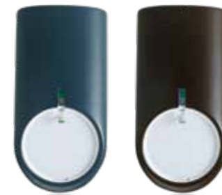
In verschiedenen Designcovers erhältlich: der Bewegungsmelder comstar VAYO pro